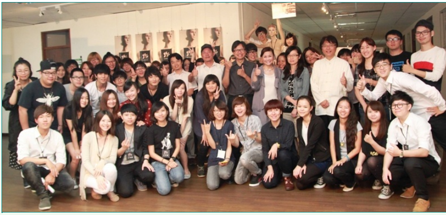
圖說：視覺傳達設計學系校內展，與會師生一同合影。